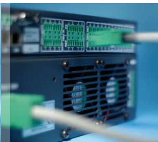
Installation nach dem „plug and play“-Prinzip: SAA-Systeme von ESSER lassen sich ohne aufwändige Verkabelung einfach per Stecker anschließen