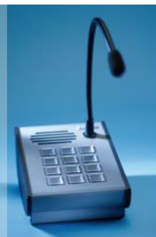
Die Digitale Sprechstelle kann sowohl Audio- als auch Steuerungssignale digital übertragen