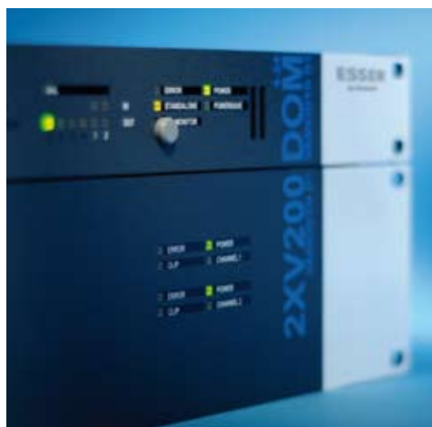
Die VARIODYN® D1-Systemkomponenten überzeugen mit ansprechendem Design und intuitiver Bedienbarkeit

ein umfangreiches Produktportfolio für unterschiedlichste Einsatzgebiete zur Verfügung – von digitalen Sprechstellen über Leistungsverstärker bis hin zum kompakten Komplettsystem.